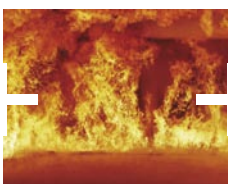
Protection contre le feu