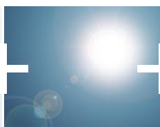
Protection contre la chaleur